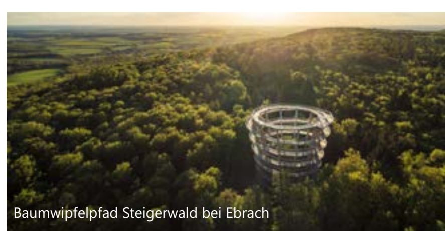
Baumwipfelpfad Steigerwald bei Ebrach