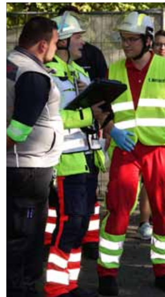
Malteser-Hilfsdienst, Rotes Kreuz und Johanniter-Unfall-Hilfe probten mit Feuerwehren aus dem Stadtgebiet Scheßlitz bei der Katastrophenschutz-Übung des Landratsamtes den Ernstfall.

H ier sind echte Profis - im Ehrenamt und im Hauptamt - am Werk!“ – Landrat Johann Kalb dankte als Leiter der Katastrophenschutzbehörde beim Landratsamt Bamberg den mehr als 200 Kräften , die bei einem sogenannten „Massenanfall an Verletzten“ den Ernstfall probten. „Auf euch ist im Notfall Verlass!“ Schauplatz der Katastrophenschutzübung war die Real-