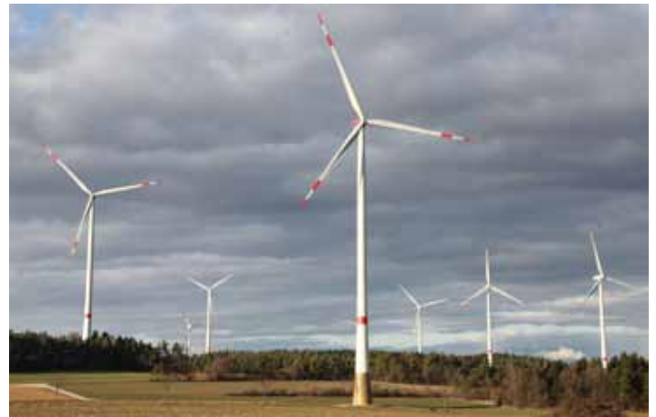
Windräder bei Neudorf im Landkreis Bamberg

Ganz konkret soll ein Bürgerwindpark mit zwei Windkraftanlagen errichtet werden. Insgesamt können so pro Windrad jährlich ca. 12 Mio. kWh Strom produziert werden. Die Gemeinde hat bereits die ersten Schritte für ein entsprechendes Antragsverfahren eingeleitet. Bis 2027 sollen die Windräder dann stehen und in Betrieb genommen werden können. Das Projekt ist dabei als echtes Bürgermodell geplant: Die Windkraftanlagen sollen in einer neuzugründenden Gesellschaft mit direkter Beteiligung der Bürgerinnen und Bürger betrieben werden. Der Sitz der Betreibergesellschaft wird in Stegaurach sein und Interessierte können mit einer Einlage ab 5.000 € Gesellschafter werden. Ziel ist es dann allen Bürgerinnen und Bürgern vor Ort den „grünen“ Stegaurach-