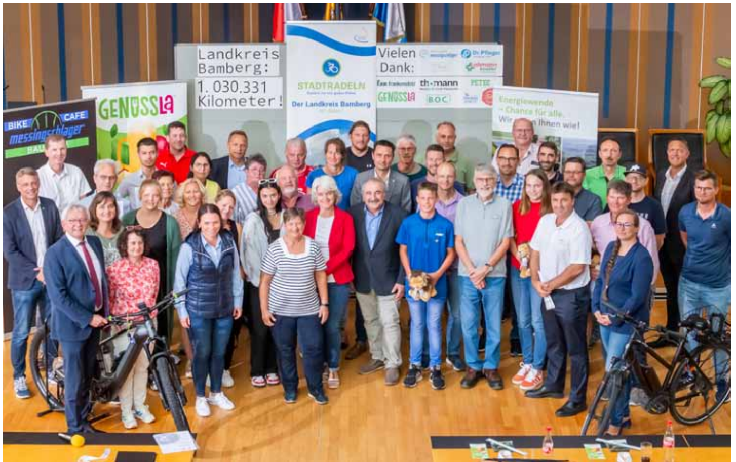
Die glücklichen Preisträger beim diesjährigen STADTRADELN